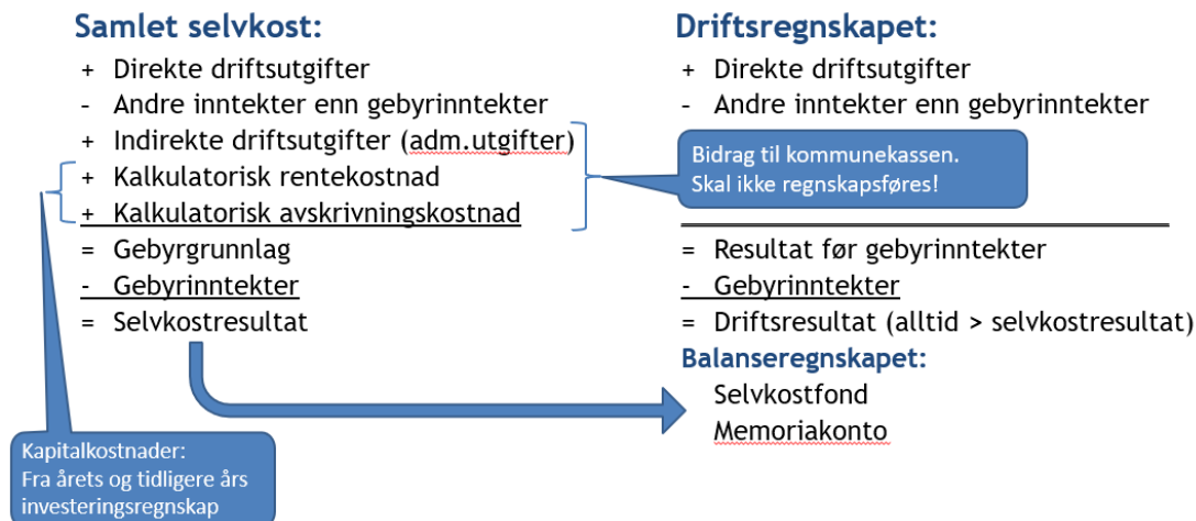
Figur 1 – Elementene i en selvkostkalkyle

Utgangspunktet for en selvkostkalkyle er kommunens drifts- og investeringsregnskap. Figuren viser at enkelte elementer beregnes på siden av kommuneregnskapene; indirekte driftsutgifter og kapitalkostnader.